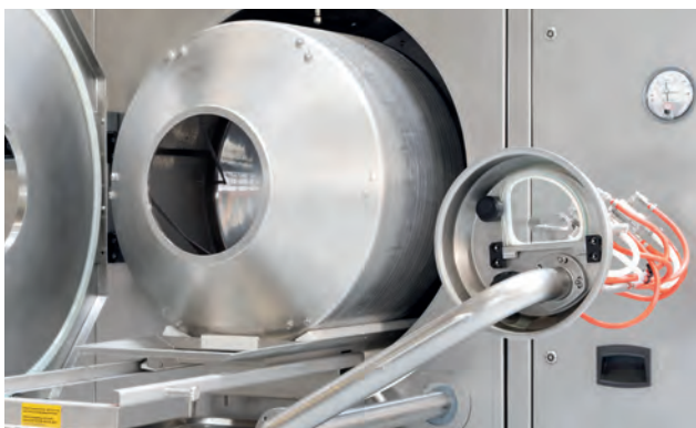
Wechseltrommel 56 l