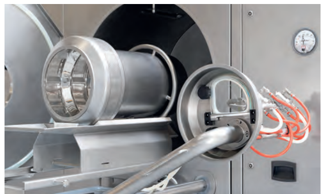
Wechseltrommel 2 l