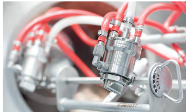
Glatt GCSD Düse